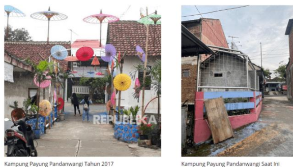
Kampung Payung Pandanwangi Tahun 2017

Masyarakat Kampung Payung terlibat aktif dalam pengelolaan infrastruktur di tempat tinggal mereka, yang terlihat jelas melalui tingginya tingkat gotong royong antarwarga, menunjukkan kesadaran dan kepedulian masyarakat terhadap pemeliharaan lingkungan sekitar mereka. Namun, ketika berbicara mengenai pengelolaan infrastruktur dalam konteks pariwisata, partisipasi masyarakat tampak sangat minim. Salah satu contoh nyata adalah ketidakberlanjutan pengembangan wisata kampung tematik Kampung Payung Pandanwangi. Saat awal peresmian sebagai kampung tematik, banyak payung kertas yang dipasang menghiasi jalan kampung, saat itu juga sempat dilakukan workshop pembuatan payung kertas yang melibatkan Karang Taruna, ibu rumah tangga, pelajar, hingga masyarakat umum [28]. Seiring berjalannya waktu kondisi ini berubah, seperti yang ditunjukkan pada Gambar 3.