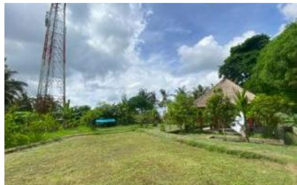
Gambar 6. Kondisi eksisting area Puspa Aman Desa Bakbakan