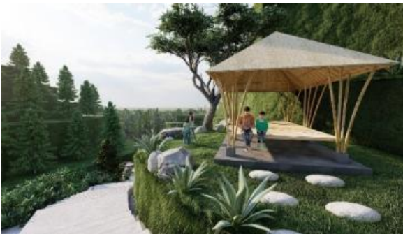
Gambar 12. Perancangan desain gazebo Bangkiang Jaran Waterfall dengan menggunakan material bambu