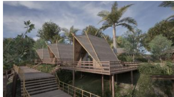
Gambar 15. Perancangan desain cabin menggunakan struktur panggung dengan material utama bambu dan kayu