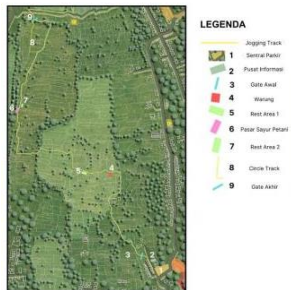
Gambar 16. Masterplan pengembangan Agrowisata

Agrowisata dikembangkan pada subak Bakbakan. Pengembangan dilakukan dengan merancang jogging track dan penambahan rest area dan warung pada rencana pengembangan pada gambar 16.