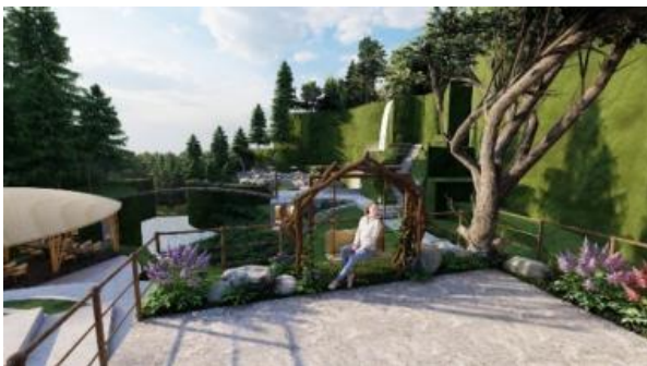
Gambar 13. Perancangan desain spot foto dengan latar air terjun Bangkiang Jaran