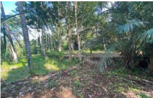
Gambar 4. Kondisi eksisting lahan untuk Glamping Bangkiang Jaran