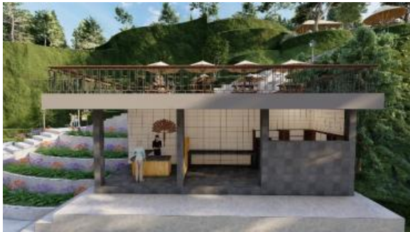
Gambar 11. Perancangan desain Kitchen dan Restaurant Bangkiang Jaran Waterfall

Pada desain bangunannya digunakan material utama yaitu bambu dan tidak menghilangkan kesan alami dari lingkungan sekitar dengan rencana perancangan gambar 11,12 dan 13.