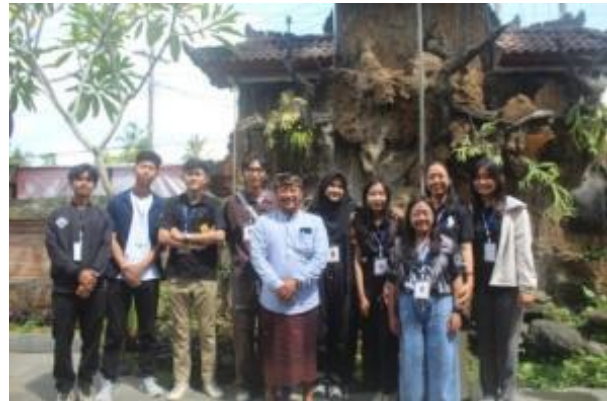
Gambar 2. Dokumentasi Wawancara dengan Kepala Desa terkait potensi objek wisata Desa Bakbakan

dekat area ini juga direncanakan adanya pembangunan penginapan berupa glamping sebagai penunjang wisatawan yang akan menginap. Selain Bangkiang Jaran Waterfall , desa ini juga memiliki potensi alam berupa sawah dan subak yang telah memiliki jalur tracking yang direncanakan menjadi objek wisata berupa jogging track subak.