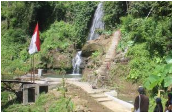
Gambar 3. Kondisi Eksisting Bangkiang Jaran Waterfall