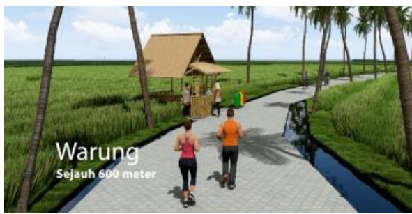
Gambar 18. Perancangan desain warung pada Jogging Track Subak di Desa Bakkaban