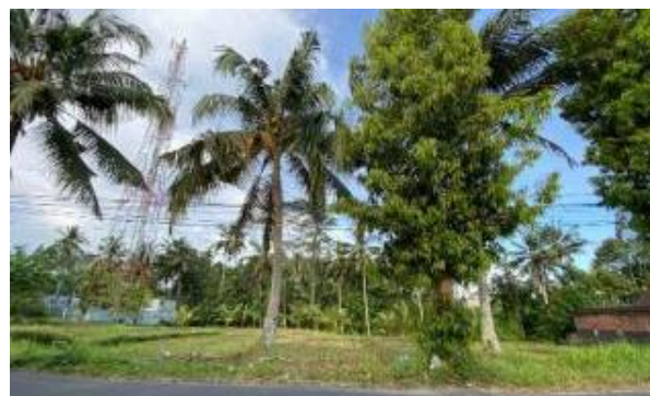
Gambar 7. Kondisi eksisting lahan Pasar Tradisional Desa Bakbakan