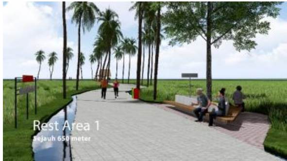
Gambar 17. Perancangan desain Rest Area pada Jogging Track Subak di Desa Bakkaban

Jalur tracking yang panjang diberikan rest area di beberapa titik pemberhentian untuk tempat istirahat maupun bersantai bagi wisatawan. Selain itu, warung mini juga diberikan di beberapa titik untuk mendukung kebutuhan kuliner yang menyediakan makanan dan minuman local dengan rancangan pengembangan pada gambar 17 dan 18.