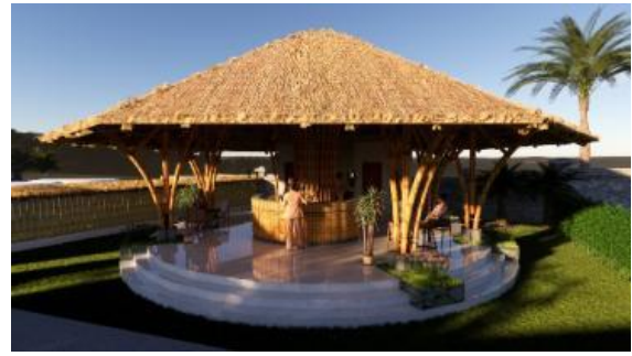
Gambar 19. Perancangan desain lobby pada Puspa Aman Desa Bakkaban dengan menggunakan struktur bambu

Revitalisasi dilakukan dengan penambahan bangunan sesuai fungsi yang dibutuhkan, seperti lobby dan toilet. Selain itu, dilakukan perancangan baru terhadap bangunan utama yang menjadi tempat berkumpulnya wisatawan dengan menambah luas bangunan agar menampung lebih banyak wisatawan. Material utama yang ditonjolkan adalah bambu. Puspa Aman Desa Bakkaban dihidupkan kembali dengan mempromosikan kearifan pembibitan tanaman local dengan rancangan pengembangan pada gambar 19 dan 20.