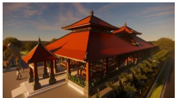
Gambar 21. Perancangan desain bangunan Pasar Tradisional Desa Bakkaban yang mengambil bentuk wantilan

Perancangan pasar tradisional Desa Bakkaban tidak hanya ditujukan untuk penjualan bahan kebutuhan masyarakat tetapi juga wisatawan. Pada pasar ini disediakan taman kuliner yang akan memperkenalkan kuliner lokal kepada wisatawan. Bentuk bangunan yang diambil adalah wantilan, karena menyesuaikan dengan budaya sekitar yang masih kental dengan arsitektur tradisional Bali sekaligus mempromosikan kearifan lokal melalui arsitektur pada bangunan utama pasar. Material yang digunakan merupakan material lokal yang tidak jauh dari bambu, bata merah, serta kayu dengan rancangan pengembangan pada gambar 21 dan 22.