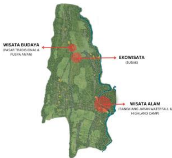
Gambar 8. Konsep Pengembangan pariwisata Desa Bakkaban

Revitalisasi di kawasan wisata Desa Bakkaban difokuskan pada objek-objek yang memiliki potensi terbesar dan menjadi perhatian pihak desa maupun masyarakat sekitar. Revitalisasi dilakukan dengan memperhatikan kearifan lokal sebagai daya tarik utama. Kearifan lokal ini akan diterjemahkan dalam konsep arsitekturnya, seperti penggunaan material lokal berupa bambu, pemilihan bentuk bangunan yang menyesuaikan konteks budaya sekitar, serta prinsip keberlanjutan lingkungan.