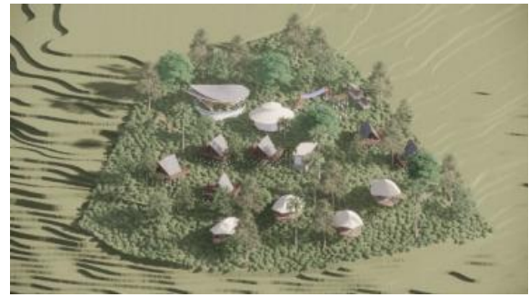
Gambar 14. Perancangan desain Glamping Bangkiang Jaran dengan peletakan bangunan menyesuaikan garis kontur

Perancangan desain pada glamping menyesuaikan kontur tanah tanpa mengubahnya berlebihan, sehingga desain yang digunakan adalah struktur panggung untuk penyesuaian kontur seperti yang terlihat pada gambar 14 dan 15. Material yang digunakan masih merupakan material lokal yang ada di sekitar site , seperti kayu dan bambu.