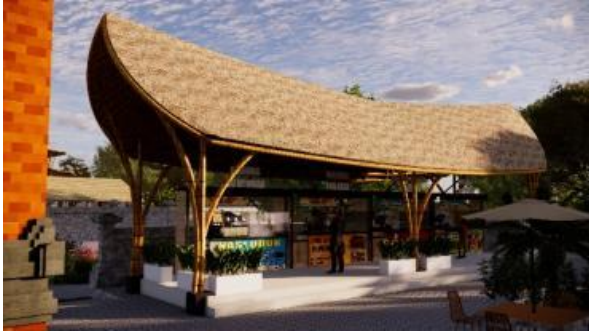
Gambar 22. Perancangan desain area kuliner lokal di Pasar Tradisional Desa Bakbakan menggunakan material bambu