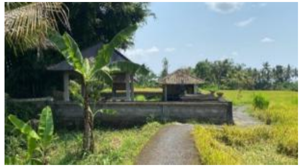
Gambar 5. Kondisi eksisting jalur tracking Subak di Desa Bakbakan