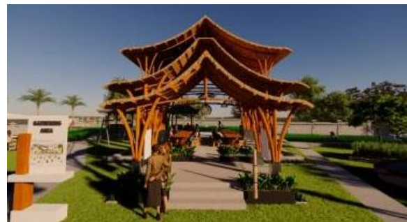
Gambar 20. Perancangan Gathering Area pada Puspa Aman Desa Bakkaban dengan menggunakan struktur bambu