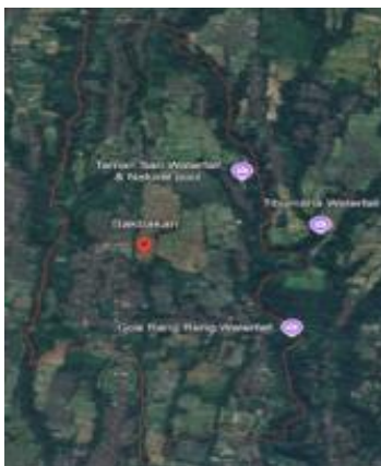
Gambar 1. Peta Titik Lokasi Objek Wisata di Desa Bakbakan

Penelitian ini membahas mengenai revitalisasi kawasan Desa Bakbakan dengan perancangan arsitektur berbasis kearifan lokal. Desa Bakbakan merupakan kawasan Desa Wisata yang berlokasi di Banjar Angkling, Kecamatan Gianyar, Kabupaten Gianyar, Bali sebagai gambar 1 berikut.