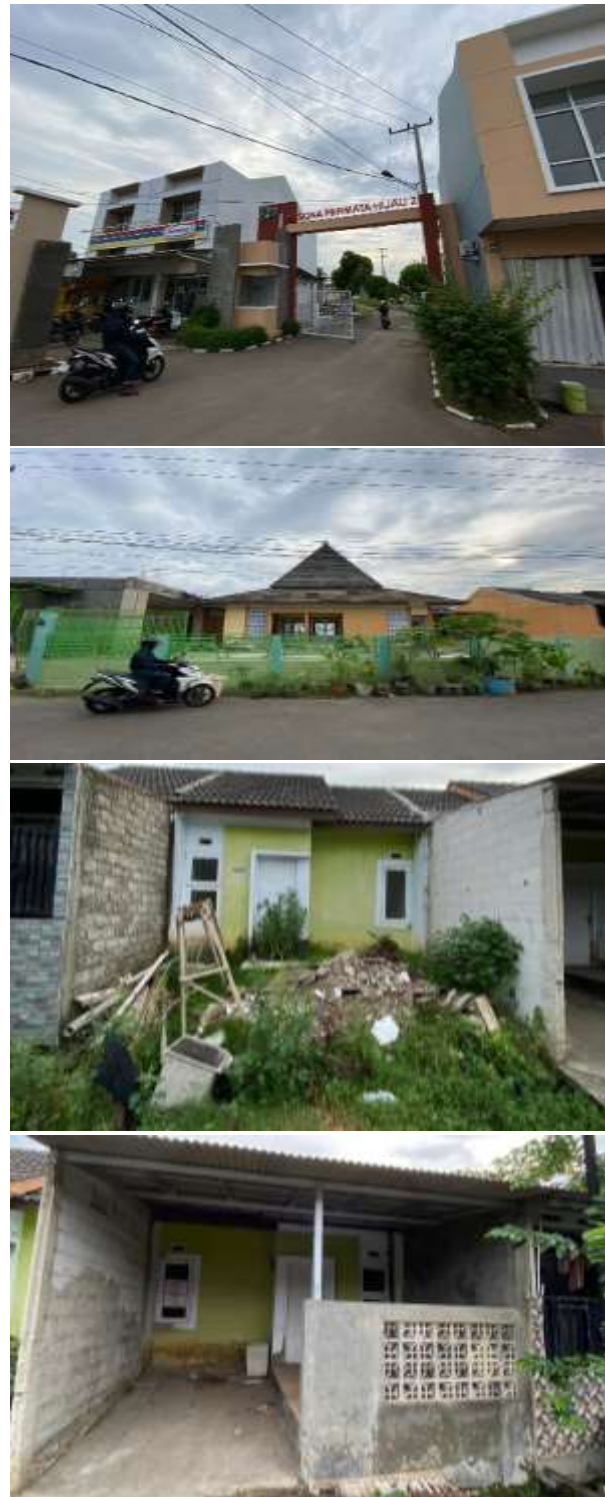
Gambar 1. Survei objek penelitian

yang dipenuhi rumput liar serta material bangunan yang terbengkalai. Dinding belum selesai diplester, bagian atap tidak lengkap, dan beberapa unit rumah tampak seperti dalam proses pembangunan yang tidak selesai atau terbengkalai.