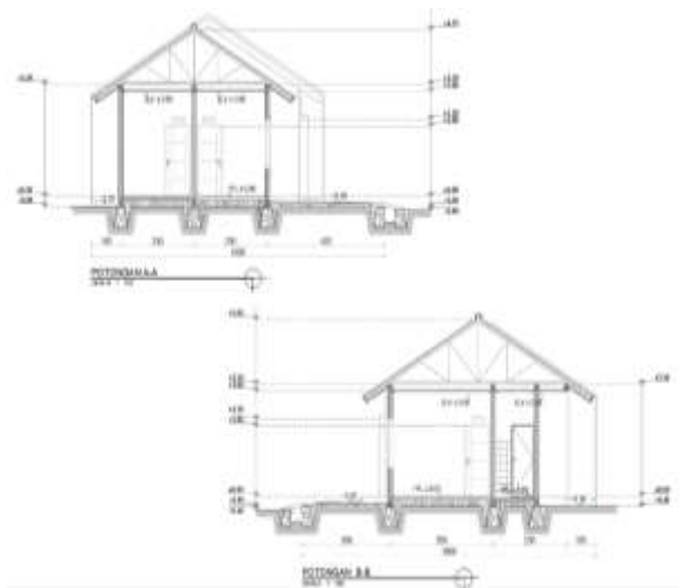
Gambar 4. Potongan rumah subsidi tipe 30/60

Seperti terlihat pada Gambar 4, material yang digunakan dalam pembangunan rumah subsidi di Perumahan Pesona Permata Hijau 2 mencakup fondasi, kolom, ring balok, dan sebagainya. Fondasi menggunakan pasangan fondasi lajur batu kali, slof beton menggunakan ukuran 15 x 20 cm dengan penulangan memakai besi Ø10 mm dan cincin memakai besi Ø8 mm. Kolom struktur beton menggunakan ukuran 10 x 20 cm dengan penulangan memakai besi Ø10 mm dan cincin memakai besi Ø8 mm. Kolom praktis beton menggunakan ukuran 10 x 10 cm dengan penulangan memakai besi Ø8 mm dan cincin memakai besi Ø6 mm. Ring balok beton menggunakan ukuran 15 x 20 cm dengan penulangan besi Ø10 mm dan cincin besi Ø8 mm.