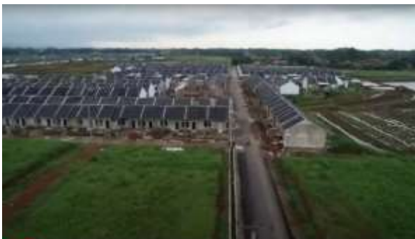
Gambar 2. Perumahan subsidi Pesona Permata Hijau 2

Gambar 2 menunjukkan kondisi kawasan Perumahan Pesona Permata Hijau 2 yang berlokasi di Desa Cinangsi, Kecamatan Cibogo, Kabupaten Subang, Jawa Barat. Terlihat barisan rumah-rumah subsidi yang tersusun rapi namun juga memperlihatkan bahwa sebagian area masih dalam tahap pembangunan dan pengembangan infrastruktur. Proyek perumahan ini dibangun di atas lahan seluas 6,8 hektar dan dikembangkan oleh PT. Griya Omega Estetika. Kawasan ini merupakan kombinasi antara unit rumah subsidi dan rumah komersial, yang dirancang untuk memenuhi kebutuhan hunian masyarakat berpenghasilan rendah hingga menengah.