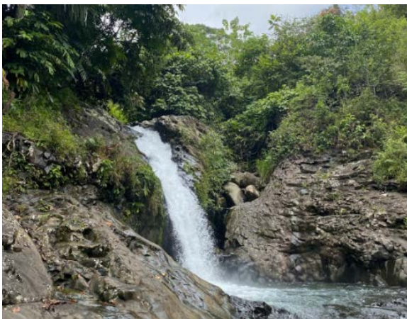
Gambar 3. Air Terjun Lubuak Kudo

Berdasarkan potensi kawasan, konsep wisata ekologis, serta kondisi saat ini, maka diusulkan berbagai jenis kegiatan wisata. Kegiatan wisata tersebut tidak hanya merupakan kegiatan utama melainkan didukung dengan berbagai wisata lainnya. Usulan tersebut ditampilkan melalui Tabel 1. Usulan tersebut menjadikan wisata air terjun sebagai daya tarik utama. Sebagai pendukung, wisata yang