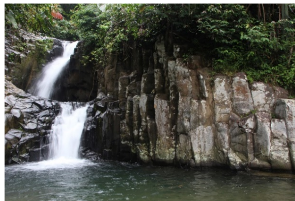
Gambar 2. Air Terjun Lubuak Tampuruang

Selanjutnya, objek yang akan ditemui adalah Lubuak Tampuruang dan Kudo seperti terlihat pada Gambar 2 dan 3. Saat ini, objek yang mulai dikelola adalah kedua objek ini sehingga gerbang dan tiketing ada di pintu masuk kedua objek ini. Jalan menuju lokasi tersebut merupakan jalan yang saat ini sebagian besar masih merupakan jalan setapak. Tiga objek air terjun lainnya memiliki lokasi terpisah yang saat ini aksesnya masih sangat sulit. Ketiga objek tersebut adalah Sarasah 2 Tingkek, Lubuak Sampik, dan Sarasah 3 Tingkek.