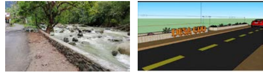
Gambar 5. Restorasi Tebing Sungai