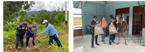
Gambar 4. Restorasi Hulu DAS dan Penaburan Bibit Ikan

Selain fasilitas-fasilitas yang sebelumnya telah disebutkan, terdapat beberapa infrastruktur lain yang perlu menjadi perhatian dalam pembangunan jangka panjang. Ulasan infrastruktur tersebut dapat dilihat pada Tabel 2.