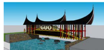
Gambar 6. Restorasi Jembatan Ba atok